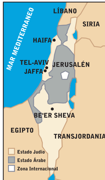
1947 D.E.C. La ONU aprobó la Resolución 181, la cuál recomendó la división de lo que quedaba del Mandato, entre árabes y judíos. Aunque la zona judía solo incluía un 13% del Mandato original, los judíos aceptaron el acuerdo. Los líderes árabes rechazaron la oportunidad de crear un estado árabe y desencadenaron la guerra contra el nuevo estado judío.