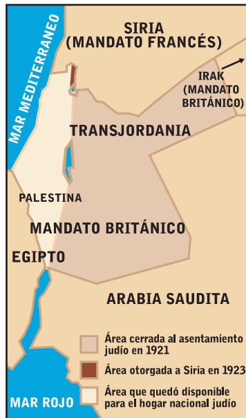
1921 D.E.C. Primera partición. Infringiendo el Mandato, los británicos cerraron el 77% del Mandato al asentamiento judío y se lo otorgaron a los árabes en lo que más tarde se convirtió en Jordania. En 1923 los británicos otorgaron otro 1% del Mandato – el Golán – a Siria. Hoy en día una gran mayoría de los jordanos son palestinos.