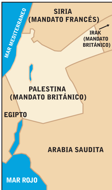
1917 D.E.C. En la Declaración Balfour los británicos se comprometieron a reconstituir la patria ancestral judía en lo que más tarde se conocería como el Mandato Palestino de unos 118.000 kilómetros cuadrados. En 1922 la Liga de Naciones formalizó la Declaración Balfour y ordenó que los británicos facilitaran la inmigración judía y la fundación de su patria. Europeos e incluso muchos líderes árabes esperaban que los judíos transformarían aquella tierra desolada. En 1919 el líder árabe Emir Faisal pidió "la colaboración más profunda con los judíos que regresaban, por el desarrollo de los estados árabes y de Palestina".