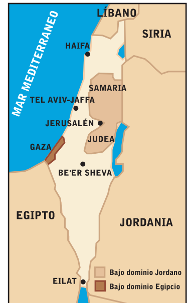
Pre-1967 Las fronteras de Israel pre-1967. Durante sus guerras defensivas contra los estados árabes, Israel capturó 31% más de territorio de lo que le había asignado la Resolución 181. Jordania capturó Cisjordania. Egipto capturó Gaza. Habiendo tomado estas tierras, ahora los árabes controlaban un 6.1% adicional y un total de un 83.8% del Mandato original, incluyendo el 77% ya otorgado a Jordania.

Para más información, vea Sachar, Howard. A History of Israel from the Rise of Zionism to Our Time , 1996. Domino.un.org/unispal.nsf , www.palestinefacts.org