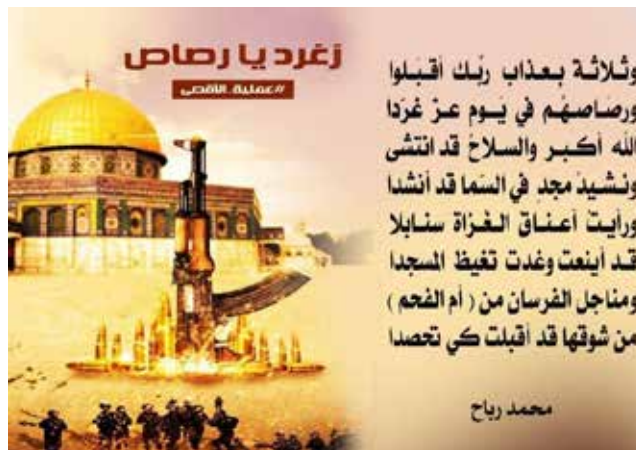
Palabras de alabanza hacia los terroristas "mártires".