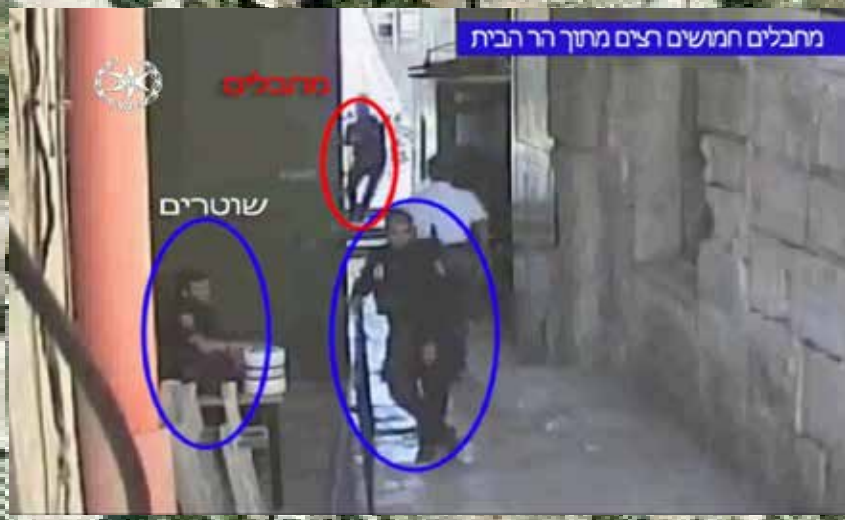
מתבלים חמושים רצים מתוך הר הבית