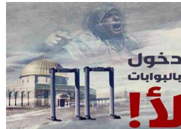
Posters promoviendo el "Día de Furia".