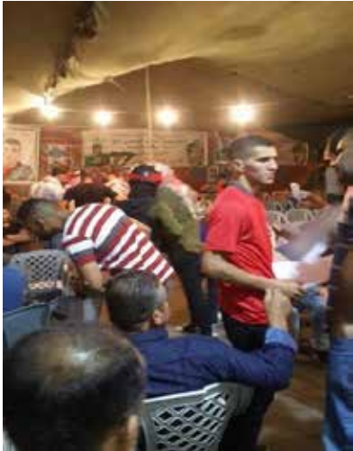
Militante armado visita las carpas de los dolientes.