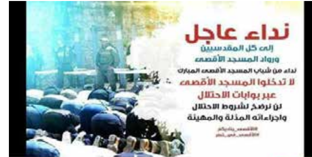
وكالة مجال الاخبارية دعوات لمسيرة حاشدة نصره للمسجد الأقصى ورفض لاجراءات الاحتلال. وذلك اليوم بعد صلاة المغرب من أمام