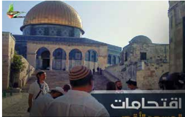
Poster de "Ataque a Al Aqsa" publicado por el Centro de Información Palestino.