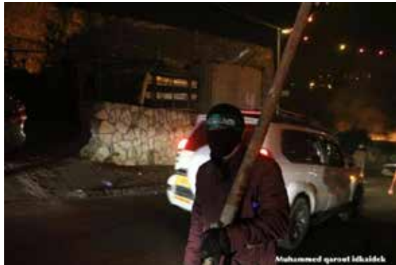
En Jerusalén Oriental