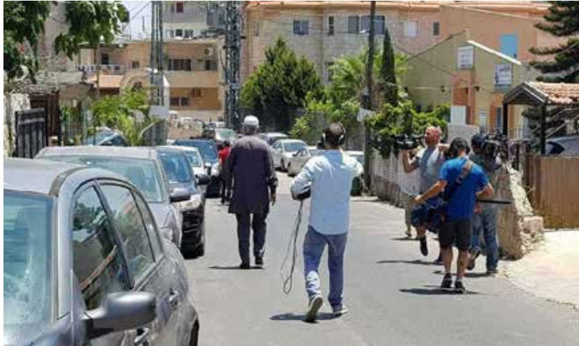
El líder del Movimiento Islámico de Israel visita a los dolientes de las familias de los terroristas.