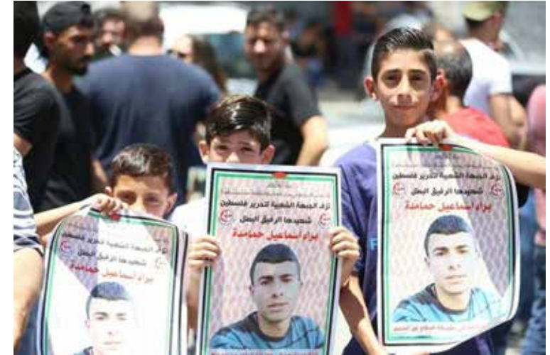
Niños palestinos sostienen carteles de los terroristas "mártires".