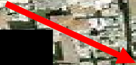
Puerta de la remisión

A las 7:10 am, tres terroristas árabe-israelíes salen del recinto del Monte del Templo y atacan a policías israelíes con rifles Carl Gustav.