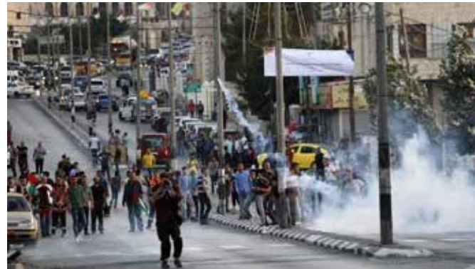
Día de la Furia en Cisjordania