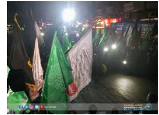
Disturbios dirigidos por Hamas en Gaza