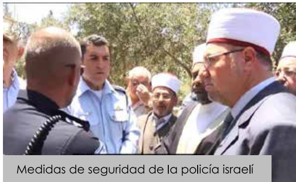
Medidas de seguridad de la policía israelí